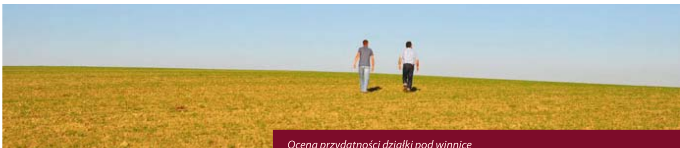
Ocena przydatności działki pod winnicę