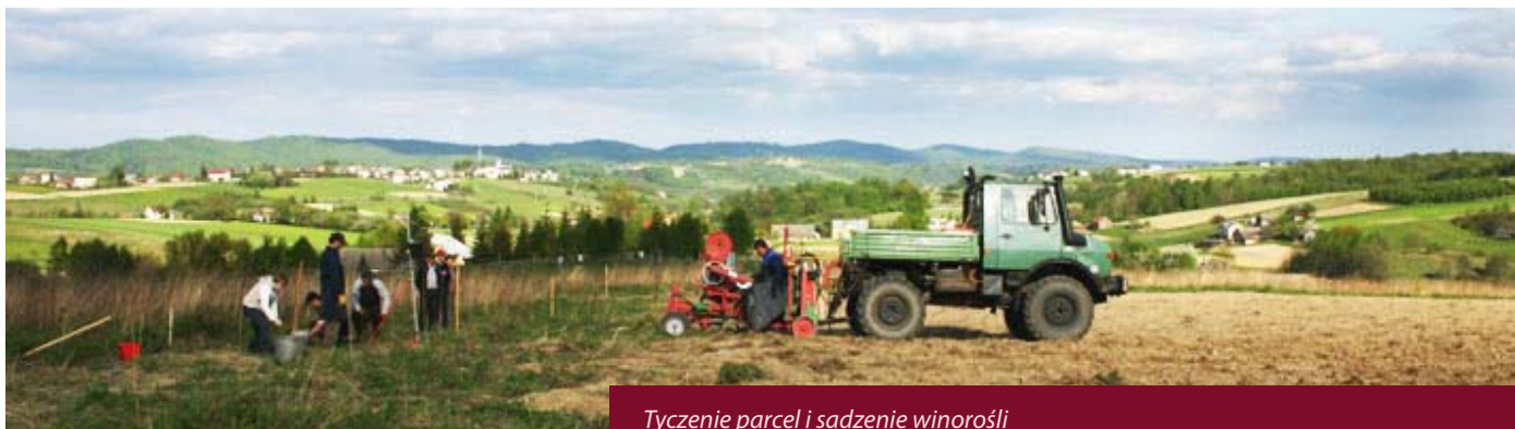
Tyczenie parcel i sadzenie winorośli