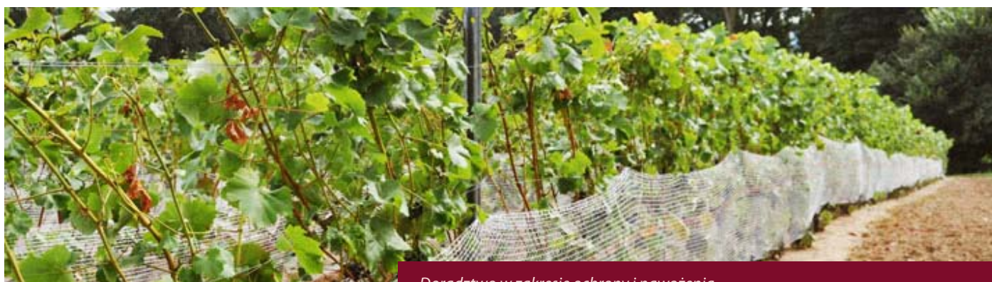
Doradztwo w zakresie ochrony i nawożenia